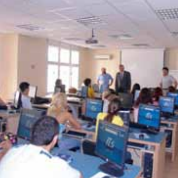
Studenti na časovima vežbi u IT sali