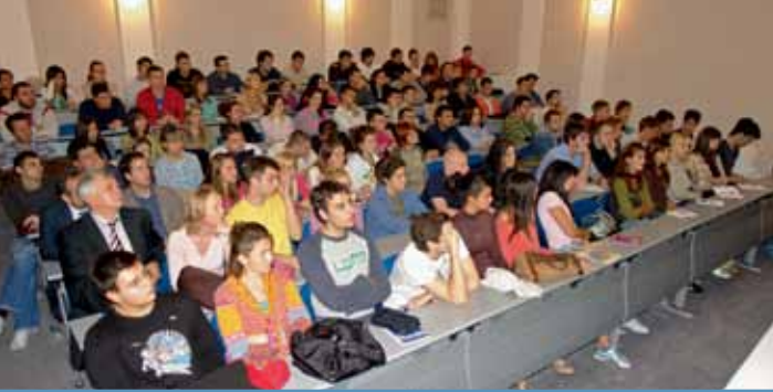
Predavanje u amfiteatru

Kad bi učenik bio kadar da odgovori na svako pitanje, čemu onda učitelj da ga uči? (Semjuel Džonson)